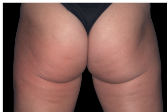
AFTER 4 th TREATMENT